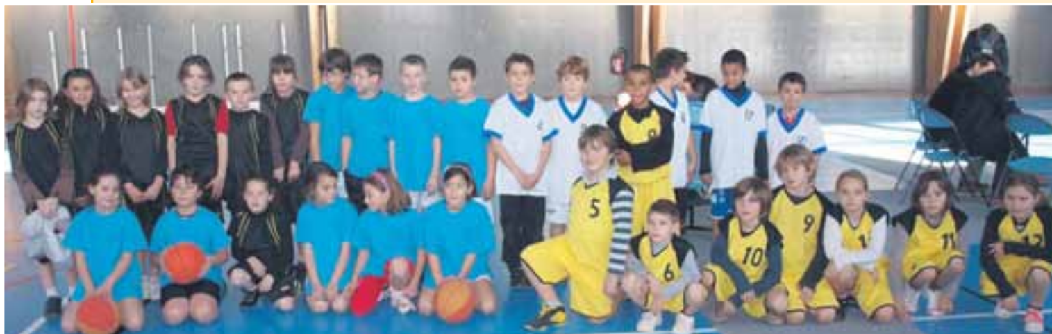
Le plateau de basket-ball de mini poussins du 12 décembre 2010.

Randonnée pédestre : le club a participé à la 21ème Fête de la Rando de Forcalquier, en animant 4 randos les 30/04 et 01/05 avec une centaine de participants.