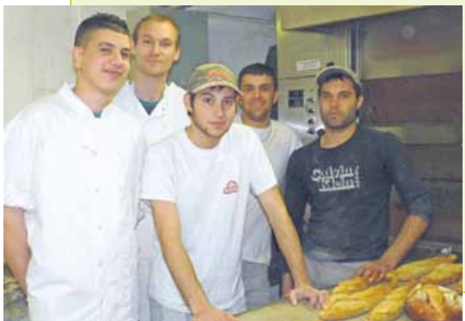
Le boulanger et une partie de son équipe.