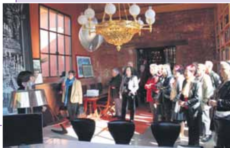
Sortie à Gargas.

Ainsi a été qualifiée la sortie à Gargas, via Céreste avec d'abord la visite de la célèbre lustrerie Mathieu. Après un excellent repas dégusté dans une ferme auberge réputée, « Le Chêne », découverte du musée des Ogres à Roussillon, avant de rentrer, la tête pleine de très bons souvenirs. Une seule ombre au tableau : malgré l'association avec le club de Céreste, le nombre de participants n'est toujours pas suffisant pour couvrir les frais d'une telle sortie. Le 31 mai, nouvelle sortie avec le Train des Pignes, avec une visite d'Entrevaux.